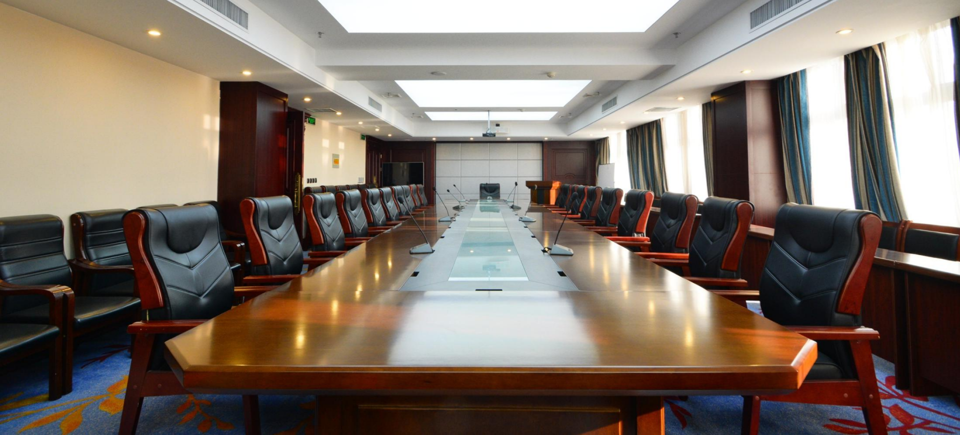
多媒体会议厅 Multimedia conference hall